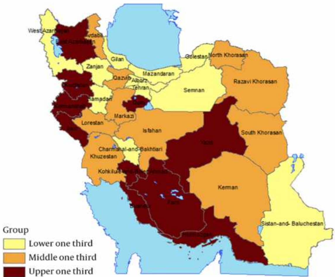
شکل شماره ۲ - پراکندگی سقط‌هایی که از نظر مصاحبه‌شونده دارای دلایل پزشکی بوده است در استان‌های کشور در موارد مستند به دلایل پزشکی، استان‌های یزد، فارس، هرمزگان، بوشهر، کهگیلویه و بویراحمد، قم، کردستان، کرمانشاه، ایلام و آذربایجان شرقی از بالاترین میزان‌ها برخوردار بوده‌اند. در موارد سقط بدون دلایل پزشکی، استان‌های فارس، هرمزگان، اصفهان، کهگیلویه و بویراحمد، لرستان، کرمانشاه، آذربایجان شرقی، آذربایجان غربی و گیلان از بالاترین میزان‌ها برخوردار بوده‌اند. شکل‌های شماره ۲ و شماره ۳.