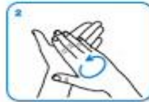
Rub hands palm to palm