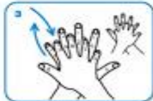
right palm over left dorsum with interlaced fingers and vice versa