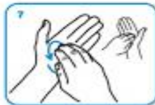
rotational rubbing, backwards and forwards with clasped fingers of right hand in left palm and vice versa.