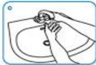
Wet hands with water

۱۰) دستمال را در سطل زباله درب دار بیندازید.