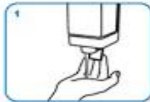
apply enough soap to cover all hand surfaces.