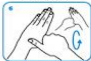
rotational rubbing of left thumb clasped in right palm and vice versa