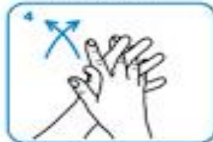
palm to palm with fingers interlaced