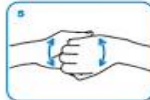
backs of fingers to opposing palms with fingers interlocked