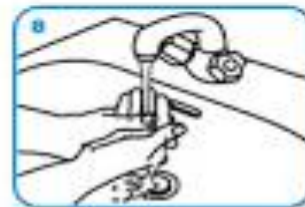
Rinse hands with water