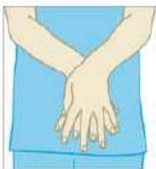
عملیات بهداشت دست ها را انجام دهید