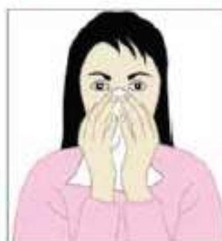
بینی و دهان خود را بپوشانید.