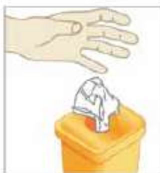
دستمال استفاده شده را بلافاصله در ظرف زباله مناسب بیاندازید.